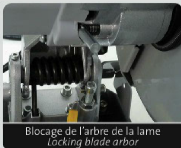
Blocage de l'arbre de la lame Locking blade arbor