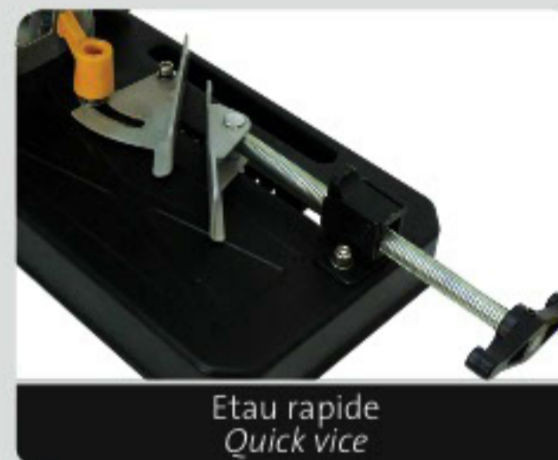
Etai rapide Quick vice