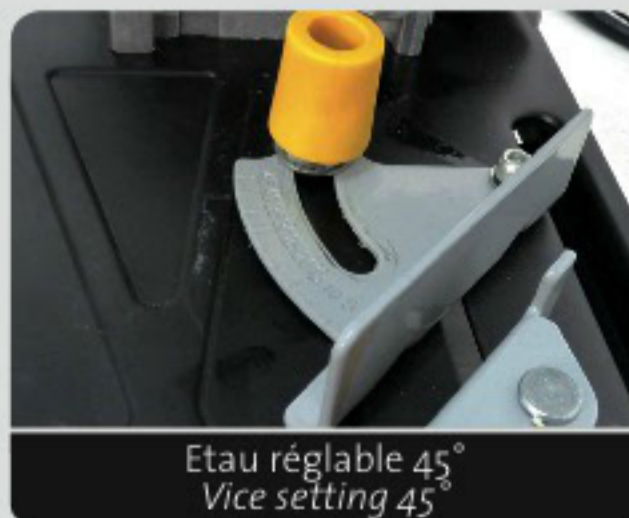
Etai réglable 45° Vice setting 45°