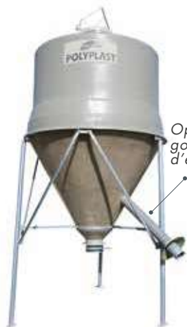
Option goulotte d'ensachage