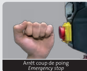
Arrêt coup de poing Emergency stop