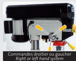
Commandes droitier ou gaucher Right or left hand system