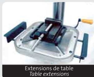
Extensions de table Table extensions