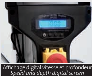
Affichage digital vitesse et profondeur Speed and depth digital screen

• 16 speeds from 220 to 2840 tr/min. • Powerfull and silent motor 550 W • MT2 Spinale • Front screen for depth and speed control • Aluminium housing motor with copper wire • Large table with 2 extensions • Pulley cover safety system with micro switch • Spindle stroke 82 mm • Table and base revised cast iron