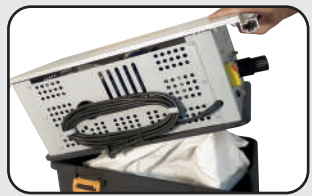
Aspirateur intégré Built in vacuum cleaner