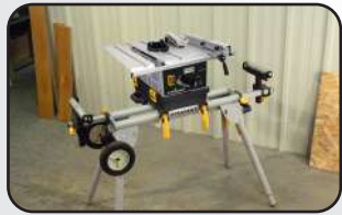
S'adapte sur support de scie Fit on miter saw stand