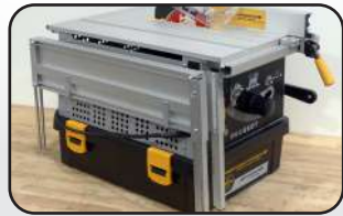
Stockage des extensions de table 580x400x410 mm (Lxlxh) Table extensions storage