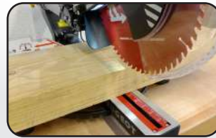
Laser + éclairage LED Laser + LED light