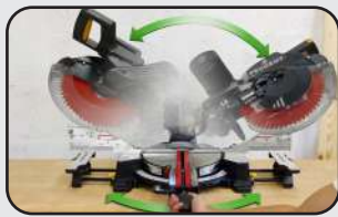
Tête inclinable gauche/droite Toutes commandes à l'avant de la machine Double bevel All control panel in front