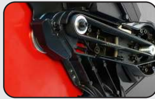
Transmission par courroie Belt driven powerful motor