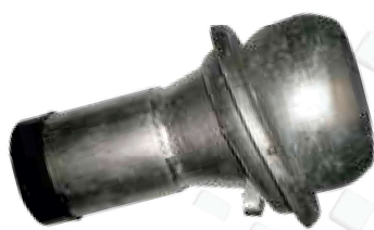
Raccord tonne à lisier