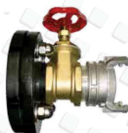
Ensemble vanne à opercule DN100 + 1/2 raccord symétrique

Véritable solution économique pour le stockage de vos effluents agricoles, nos citernes souples vous apportent de nombreux avantages :