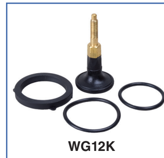
Kit d'entretien WG12K adapté pour les buses Powerjet larges de section Ø19, 25 et 32 mm