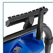
RANGEMENT FACILE DES ACCESSOIRES