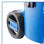
BONNE STABILITÉ ET MANIABILITÉ